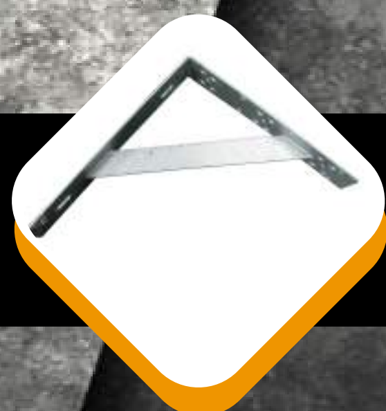
SOPORTE METAL MONTAJE SECCIONADOR